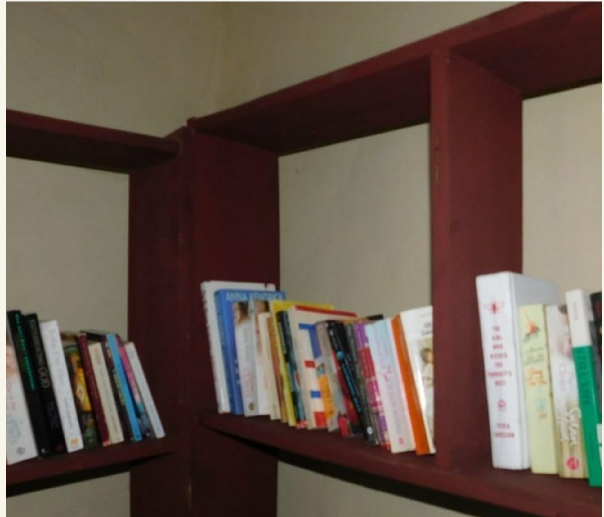
Photo de la bibliothèque du camp de Nakivale

La bibliothèque a accueilli de nombreux lecteurs de janvier 2020 à mars 2020, lorsque le monde a été envahi par la pandémie. Pour des raisons de sécurité, nous avons dû fermer la bibliothèque pour assurer la sécurité de tous ceux qui viennent lire les livres ainsi que pour le bibliothécaire qui s'occupe de la bibliothèque