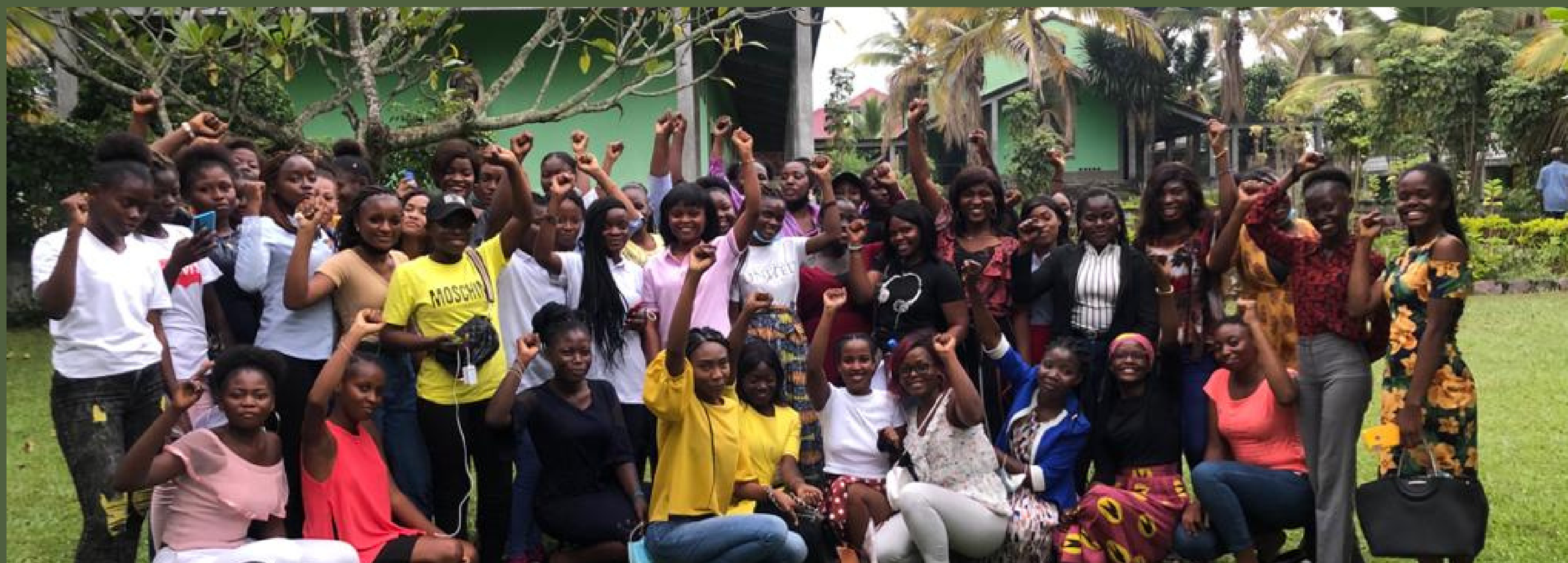
Photo prise lors de Girl Talk à Kinshasa