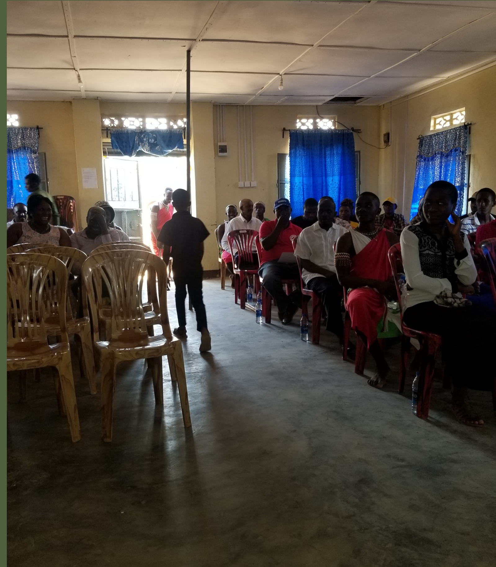
Photo prise lors d'un événement communautaire dans notre bibliothèque du camp de Nakivale