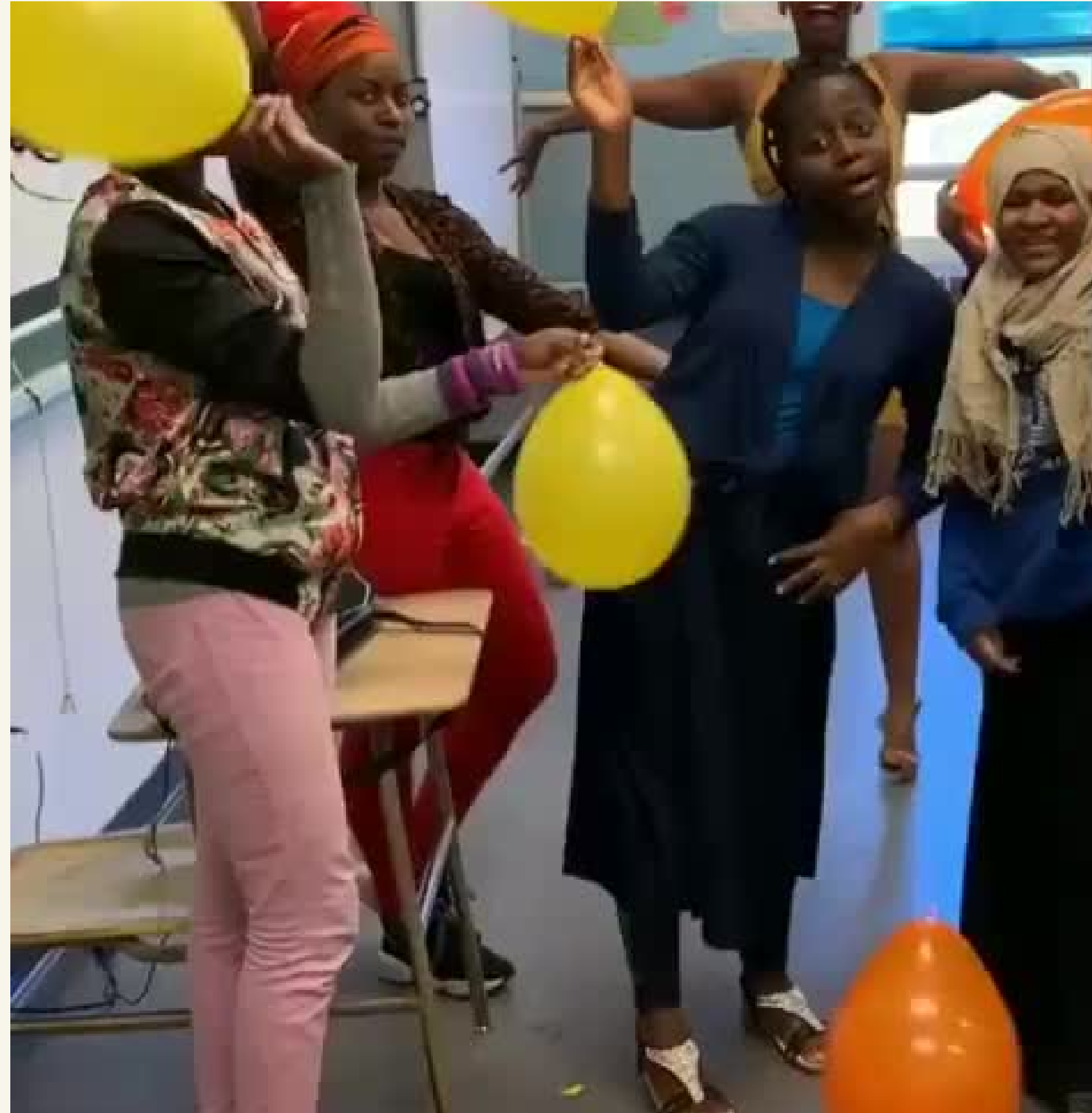
Photo de Girl Talk au lycée de Lewiston

Cependant, nous avons effectué la transition numérique de nos conversations habituelles entre filles dans le Maine. Zoom est devenu notre outil d'organisation pratique. Nous sommes reconnaissants envers Maine Humanities et Maine Initiatives qui nous ont donné les subventions qui nous ont permis de couvrir les coûts numériques.