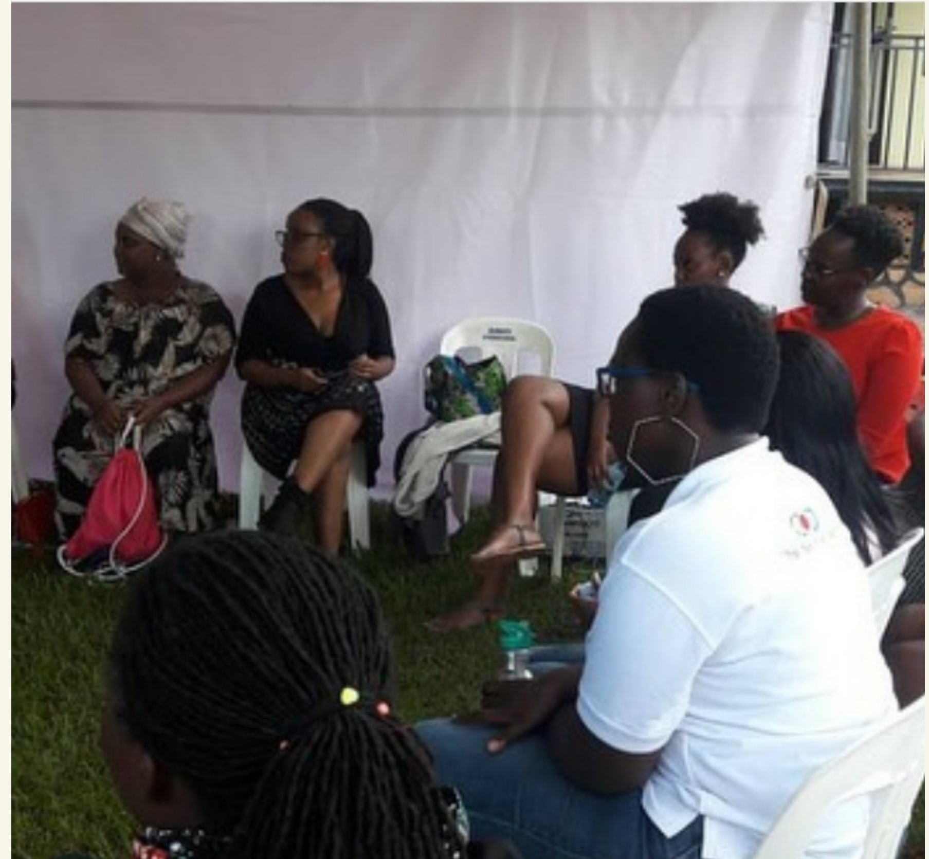
Picture during Girl talk in Uganda

Cette transition numérique particulière a également été rendue possible par notre partenaire Urgent Action Fund Africa.